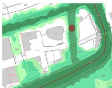
Auszug aus Naturgefahrenkarte GIS „Überschwemmung Kt. BL“